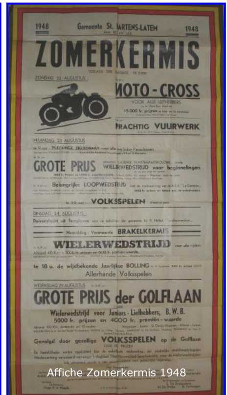
Affiche Zomerkermissen 1948