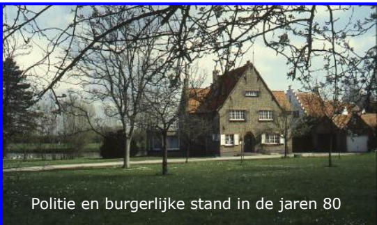
Politie en burgerlijke stand in de jaren 80

Nieje, veur Birke en zijn gaade gien wildgedoe mee de fiesten en zoekers gien geknal van 't vierwark. Gulder doe't moar zulle, geniet van 't leven en de geneugten moar veur ons gien koaters of katinnen. Zij veurzichtig en stelt da goe in 't nieuwe jaar !