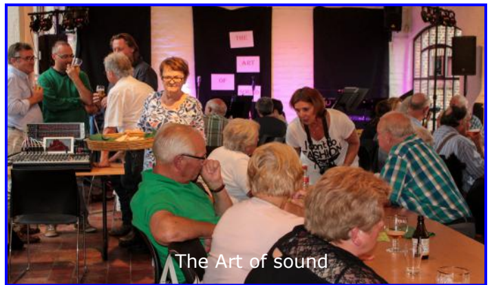
The Art of sound