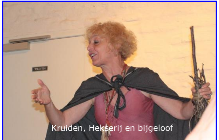
Kruiden, Hekserij en bijgeloof