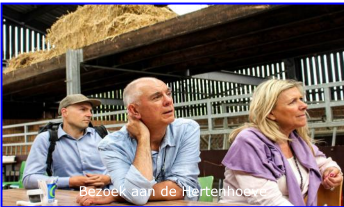
Bezoek aan de Hertenhoeve