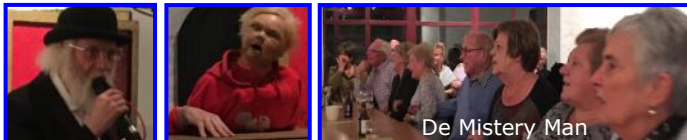
De Mistry Man